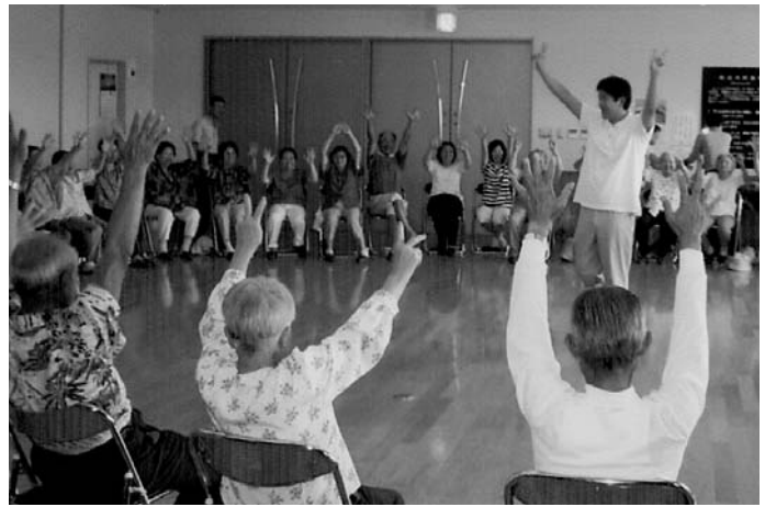
特別養護老人ホーム真寿苑から講師を招き”健康体操”を学ぶ参加者