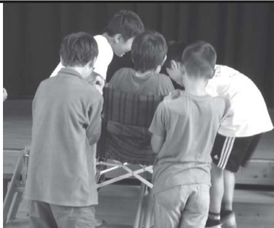
車イス体験の様子

福祉学習でお世話になる方々との出会いを大切に考えています。また、車イス体験などを通して考えたことを、これからの行動に生かしていくことを願っています。子どもたちには、自分も含めて、まわりの人を大事にできる心を、福祉学習をきっかけに培いたいです。