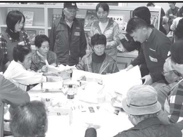
簡易トイレ作成の様子

また、住民やボランティア団体の協力を得て要援護者の抱える不安やニーズを把握したりすることで、普段からのつながりづくりの大切さを知る機会となりました。