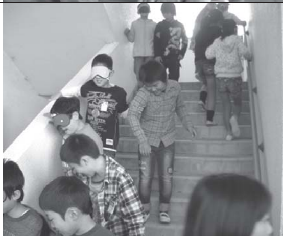
アイマスク体験の様子

田辺第三小学校4年生は2学期の総合的な学習の時間に福祉についての学習をしています。聴覚障害の話聞かせて頂き、アイマスク体験をした児童の感想です。 ・アイマスク体験をして目の不自由な人が階段を上り下りするのがどれだけ怖いか分かりました。 ・何度も練習して目玉焼きができるようにになった話を聞いて僕も見習いたいと思いました。