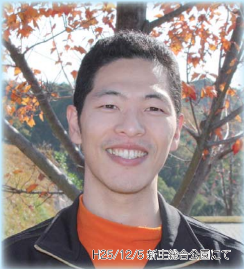
H25/12/5 新庄総合公園にて

本誌では、福祉職場で働く入社2年以内のスタッフを紹介しております。皆さまのご応募お待ちしております。