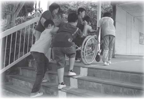
車イス体験の様子

4年生は総合的な学習の時間に「福祉」について学んでいます。「車イスに乗っている人の怖さが分かって大変だと思いました。これからは、車イスに乗っているお年寄りや体が不自由な人が困っていたら、出来る事は手伝い助けようと思いました。心のバリアフリーは大切だと思います。」(児童の感想文より)